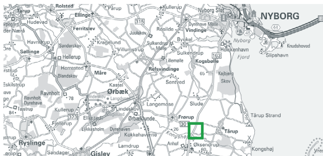
© Kort & Matrikelstyrelsen (G. 21-01)

Den lave plante kendes let på sine store grønne blade. Roen sås i rækker i april-maj og høstes i oktober-november. Sukkerroerne laves til sukker og affaldet bruges som kvægfoder.